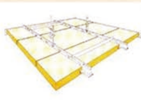
4. 吊顶-可见T型龙骨, 板材 可拆卸边角处理: VK-10