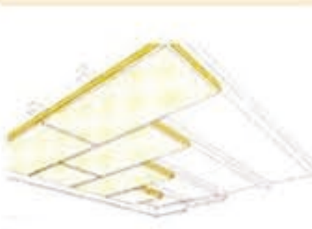
1. 固定在木龙骨上 边角处理: AK-0