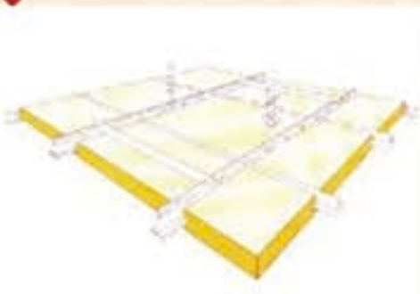
3. 吊顶-板材不可拆卸 边角处理: VK-99