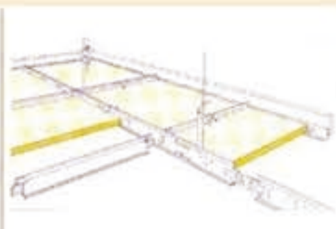
2. 吊顶-可见T型龙骨 边角处理: AK-04